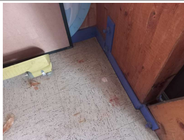
Prélèvement - P006 : RDC / Club House - Dalle de sol- (Présence d'amiante)