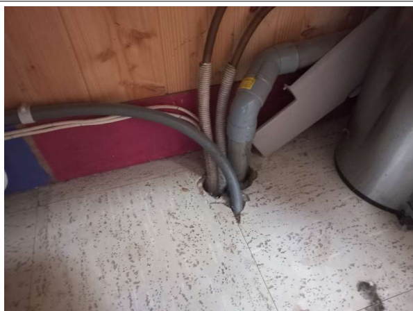
Prélèvement - P005 : RDC / Club House - Dalle de sol- (Présence d'amiante)