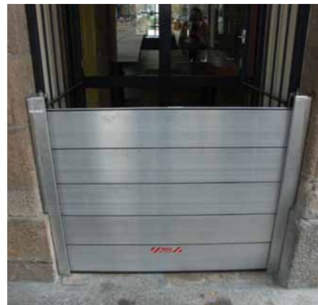
Mise en place d'un batardeau à la mairie de Morlaix.

Les services de la ville de Morlaix ont recensé toutes les ouvertures par où l'eau peut pénétrer dans les près de 300 bâtiments concernés. Les batardeaux à mettre en place représentent plusieurs centaines de mètres linéaires. La labellisation du PAPI permettra de mobiliser des financements pour aider les occupants à s'équiper.