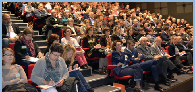
Rencontre sur l'intercommunalité organisée par les CDG bretons à Josselin le 5 novembre dernier

Pour contacter un consultant : 02 98 64 19 74 - consultants@cdg29.bzh