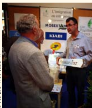
Carrefour 2010

Nouveauté au niveau 2 du salon exposant: l'aménagement d'un espace café vous permettra de faire une pause dans votre découverte des stands, et si vous le souhaitez de visionner un court métrage plein d'humour interprété par les maires de l'AMF 35 : une pause sourires -ou rires- assurée !