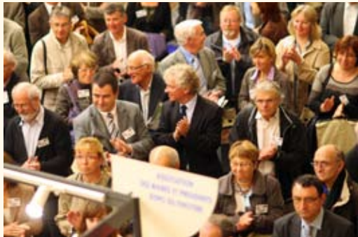
Carrefour 2010

Le paysage communal et intercommunal change au rythme soutenu de réformes d'envergure et de changement sociétal profond... dans le même temps une diminution des financements publics se profile. D'où la question centrale de ce Carrefour 2012 « Communes et communautés : faire face ensemble, avec quels moyens ? »