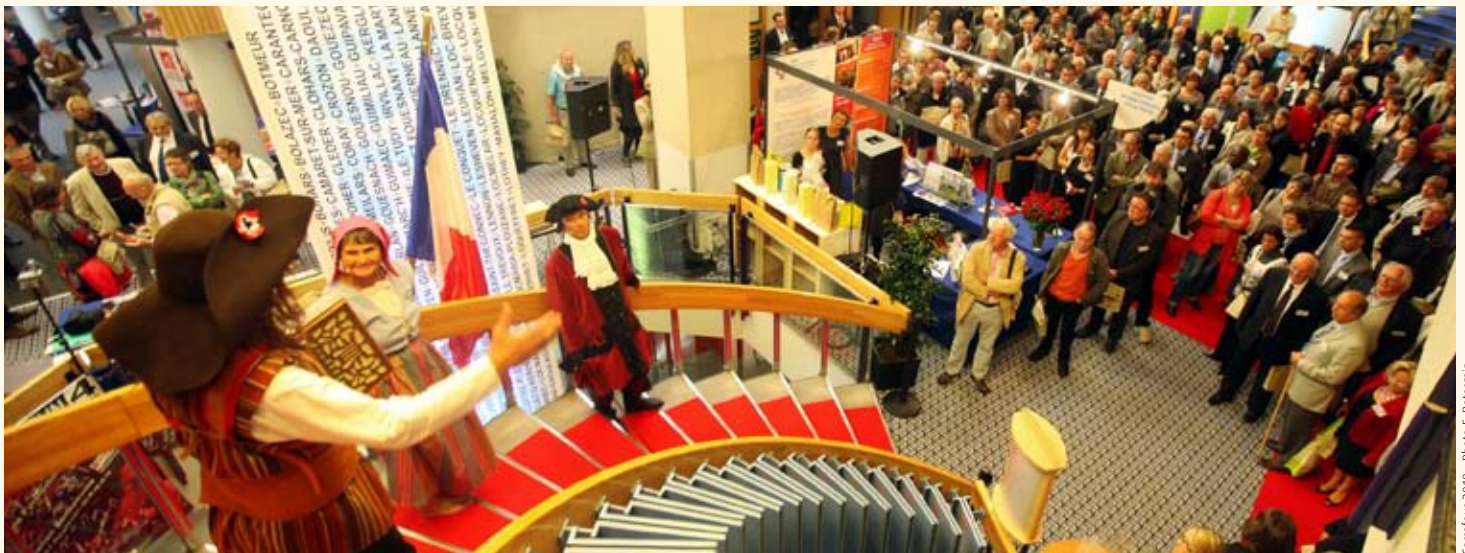
Carrefour 2010