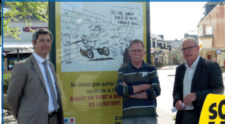
Saint-Evarzec, affiche alcool

Contact DDTM 29 : Coordination Sécurité Routière du Finistère 2 boulevard du Finistère - CS 96018 29325 Quimper cedex Tél. : 02.98.76.52.14 e-mail : ddtm-srs-usr@finistere.gouv.fr