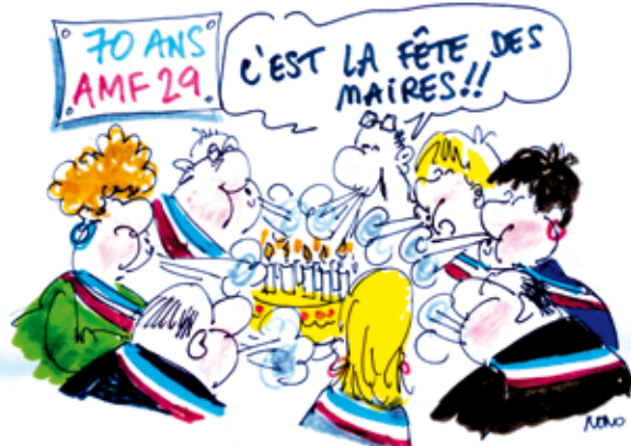
Sur les 2 jours, dessins sur le vif du dessinateur Nono

Pour découvrir tout cela et souffler ensemble les bougies aux côtés de personnalités nationales, vous êtes conviés à la clôture musicale et théâtrale marquant cet anniversaire, le vendredi 7 octobre à 17h, en grand théâtre du Quartz-Congrès !