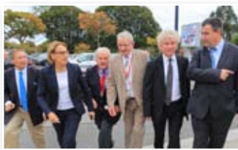
Accueil ministériel sur le parvis du Quartz

90 exposants répartis sur 1 000 m 2 d'exposition