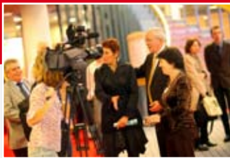
Une 5 e édition couronnée de succès