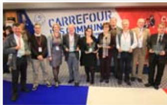
Remise des Trophées 2012 (6 catégories)